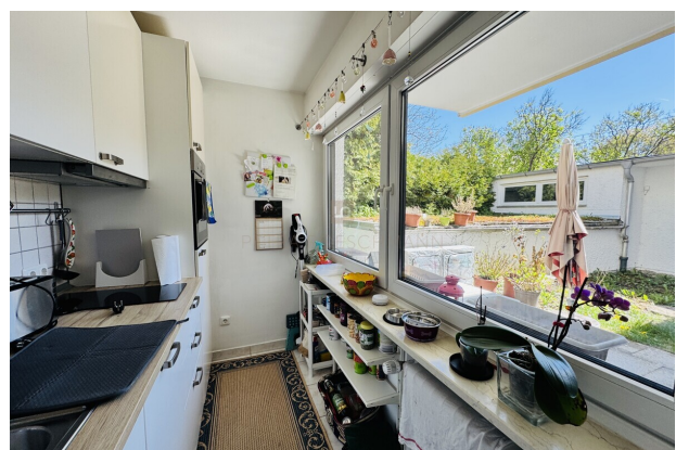
Küche extra mit Blick auf die Terrasse