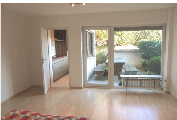
Wohnbereich mit Blick auf die Terrasse