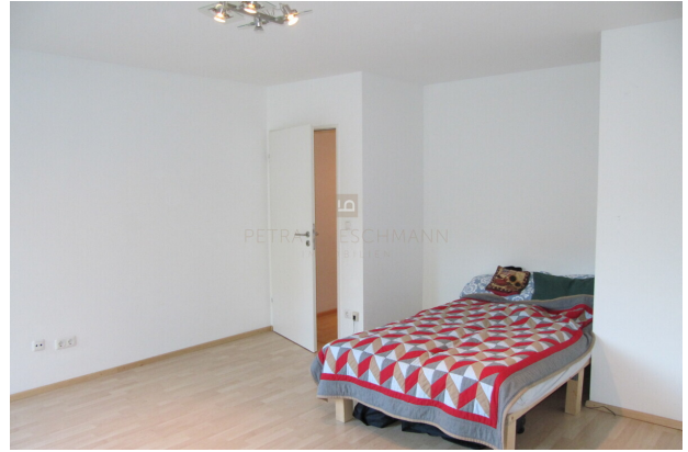
Schlafnische im Wohnbereich