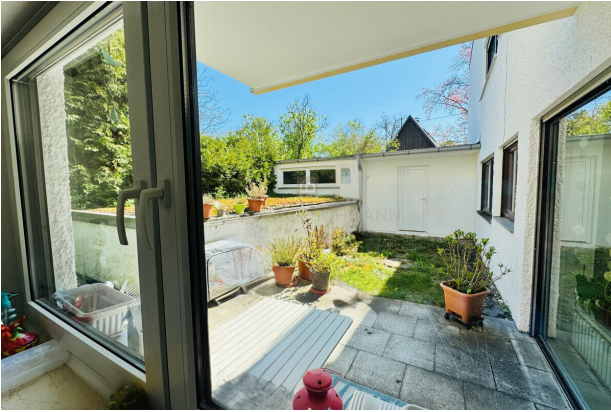
Blick auf die Terrasse