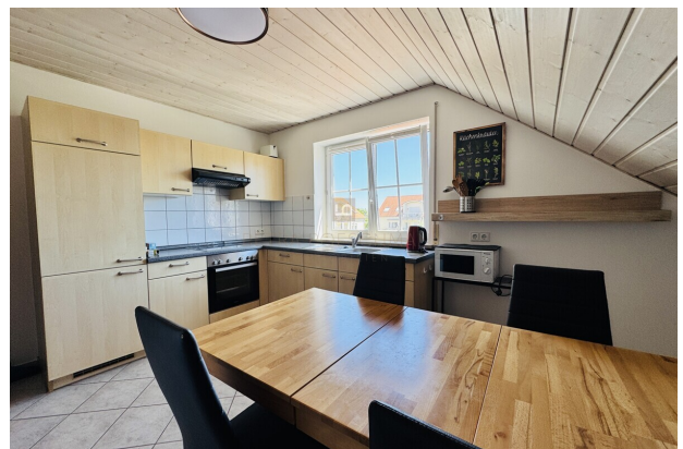
Einbauküche mit Essbereich