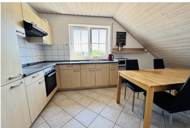
Einbauküche mit Essbereich