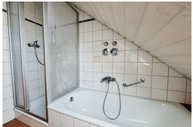
Badewanne + Dusche