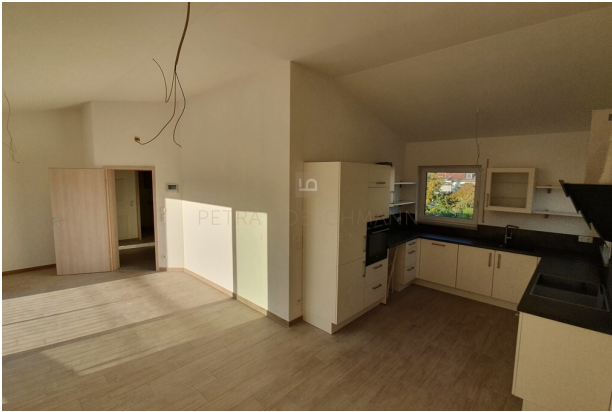
Wohnen und Küchenbereich