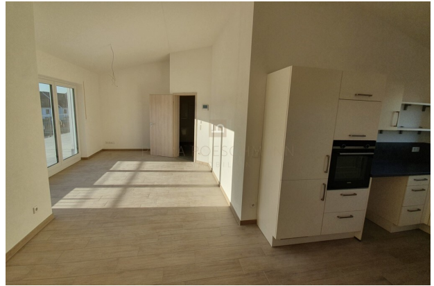
Ess- und Wohnbereich