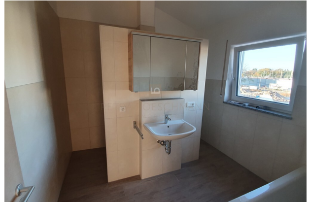
Bad mit Dusche und Wanne