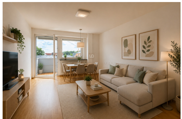
WohnEsszimmer virtuell möbliert