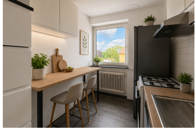
Küche virtuell möbliert