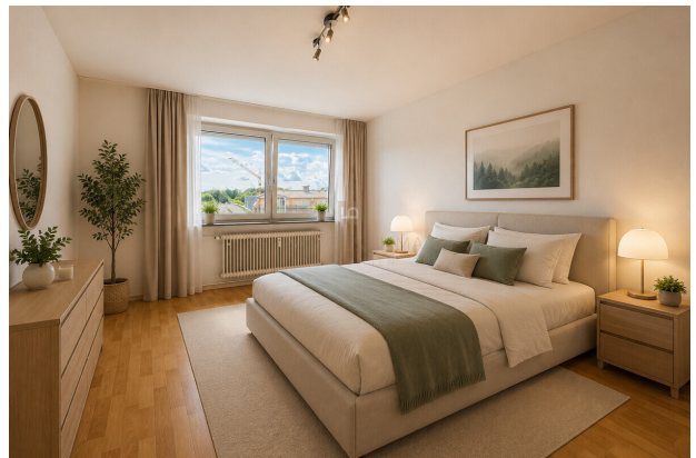
Schlafzimmer virtuell möbliert