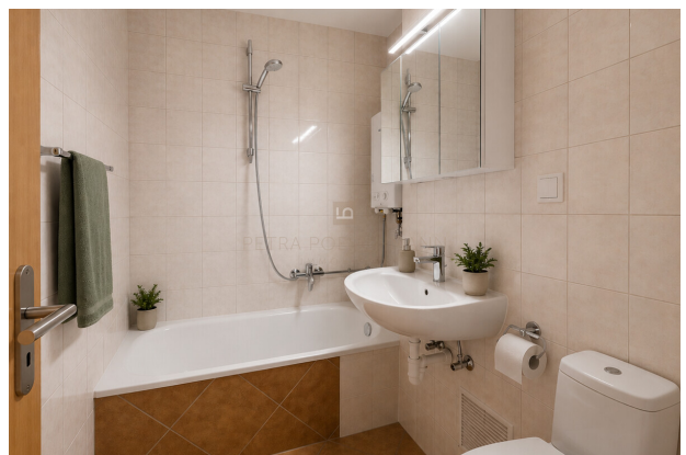
Bad virtuell möbliert