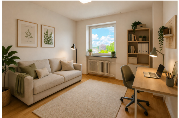
Büro virtuell möbliert