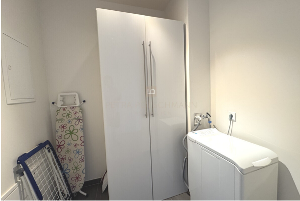
Abstellraum mit Schrank und Waschmaschine