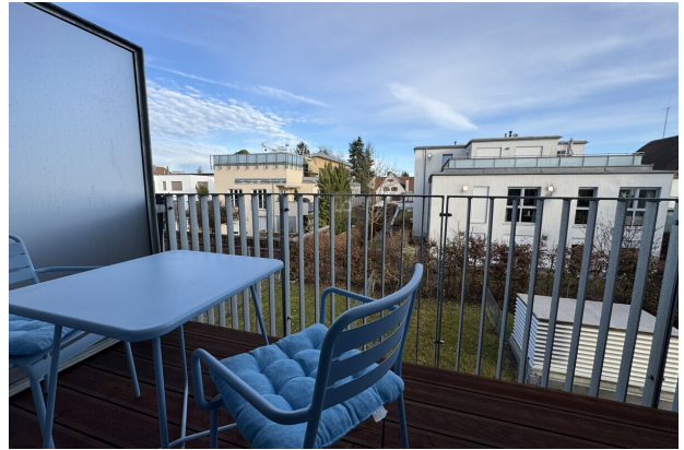
Balkon mit Aussicht-absolut ruhig