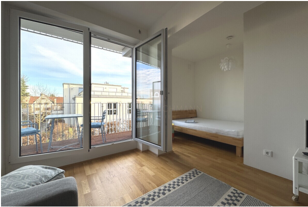
Balkon und Schlafnische