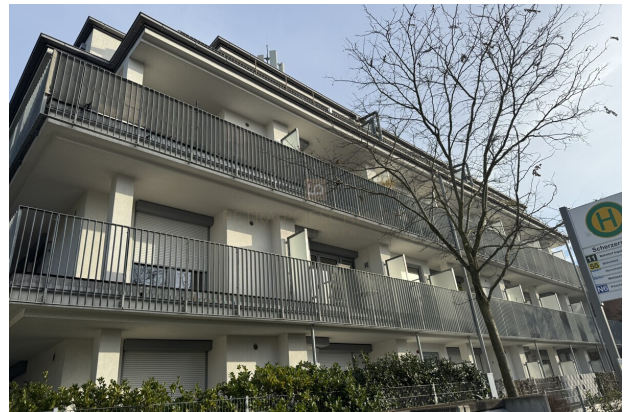
Hausansicht-Bushaltestelle vor der Tür