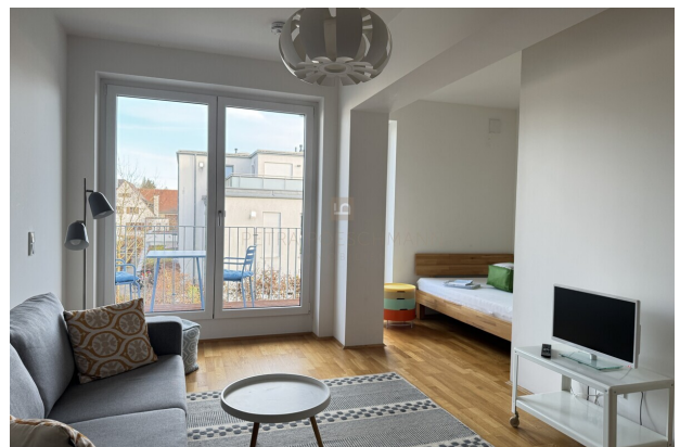
Blick zum Balkon