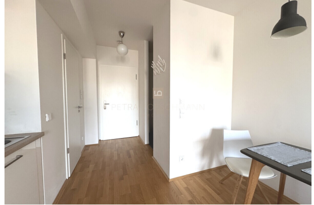
Eingangsbereich mit Abstellraum