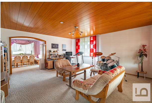
Wohnzimmer mit Blick zum Esszimmer