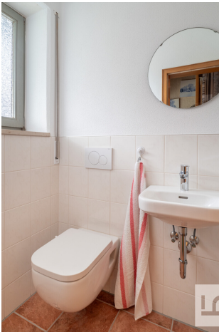
Gäste-WC erneuert 2025