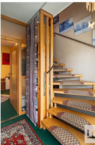
Eingangsbereich mit Treppenaufgang zum DG