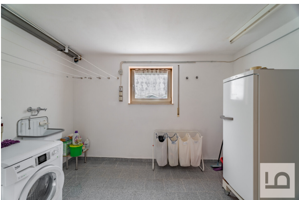
Waschkeller im UG 2025 neu gefliest und gestrichen