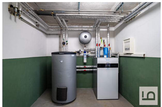
Neue Wärmepumpe-Heizung mit Warmwasserspeicher, Bj. 2025