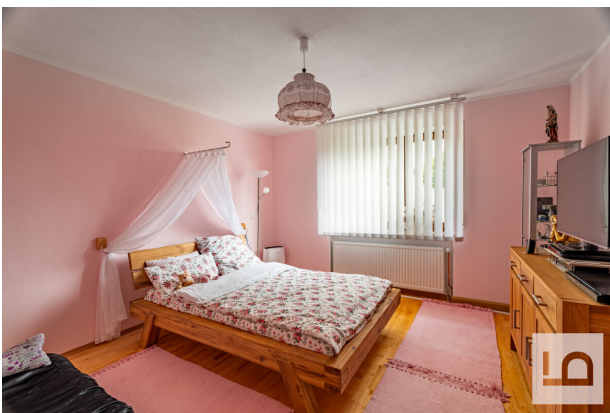
Schlafzimmer I im EG