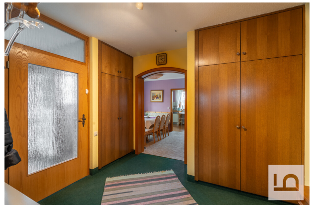
Dielenbereich mit Einbauschränken