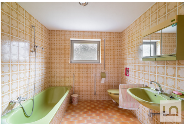
Bad im UG