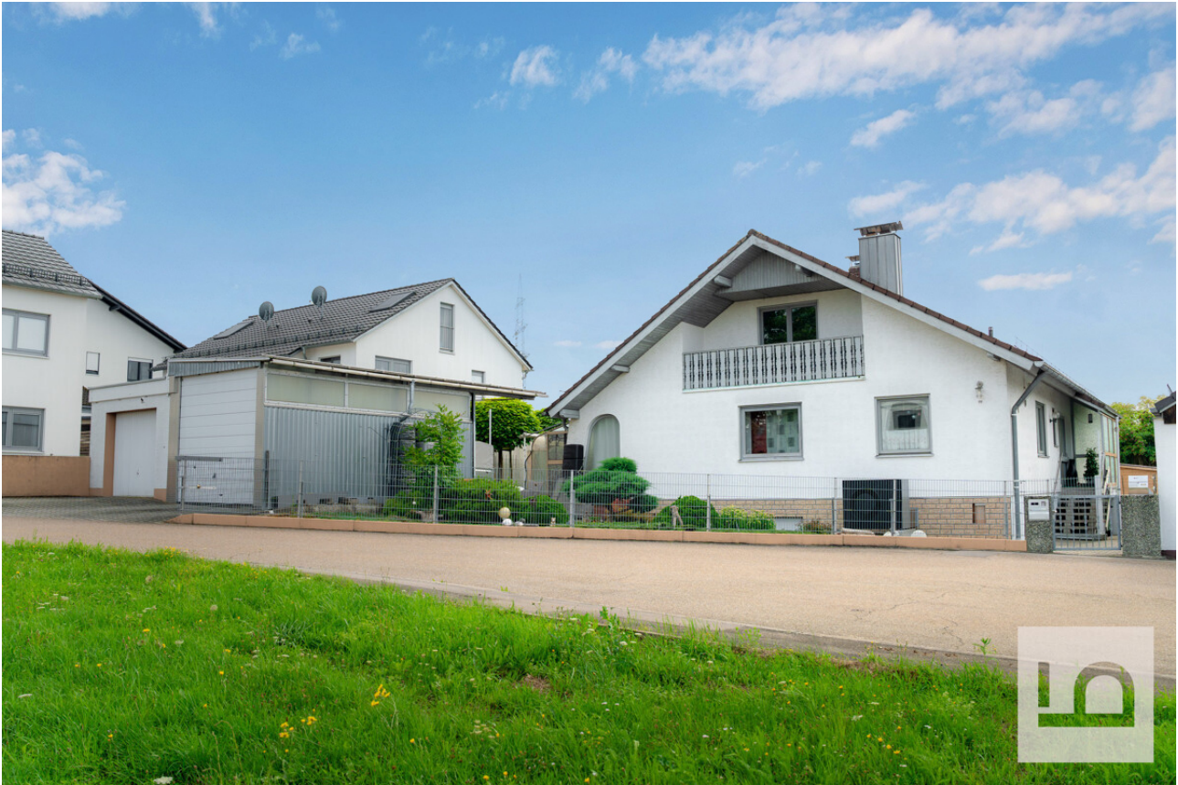
Hausansicht mit Garagen