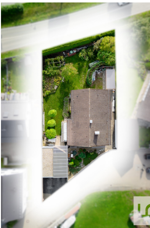
Grundstück von oben