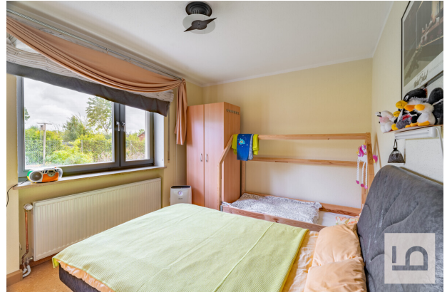
Schlafzimmer III im EG