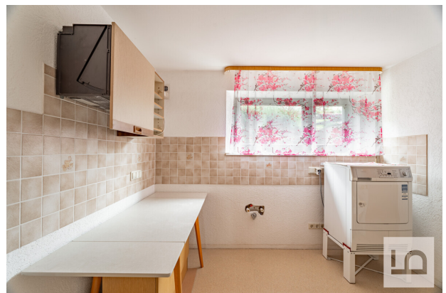
Küche vorbereitet im UG