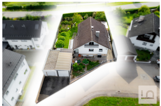
Ansicht von oben