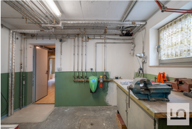
neue Heizungsrohre 2025 und Erneuerung in letzten 10 Jahren