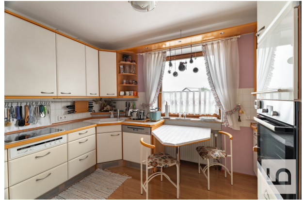
Küche mit kleinem Esstisch