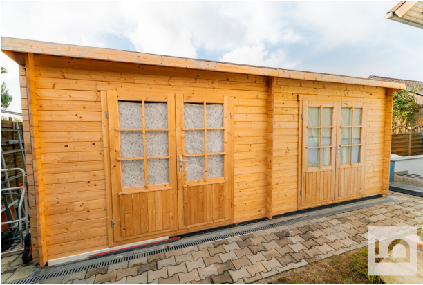
Neues Gartenhaus , 2024, mit 2 getrennten Abstellmöglichkeiten