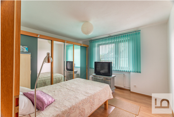
Schlafzimmer II im EG