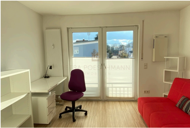
App m. Möbel