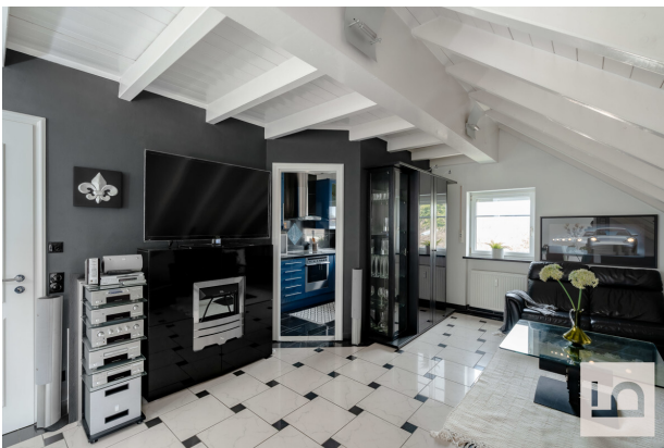
Blick zur Küche