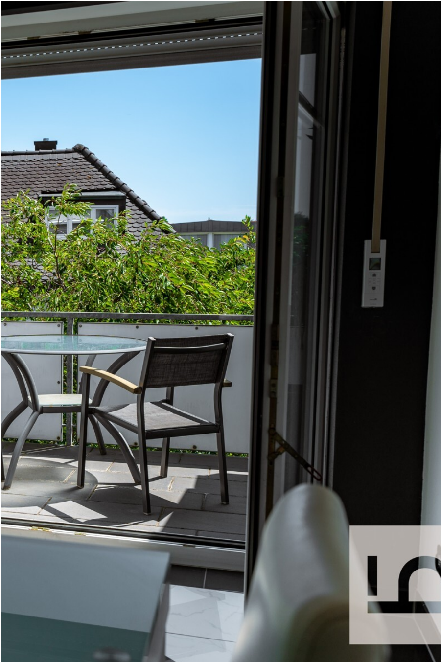
_Blick zum Balkon