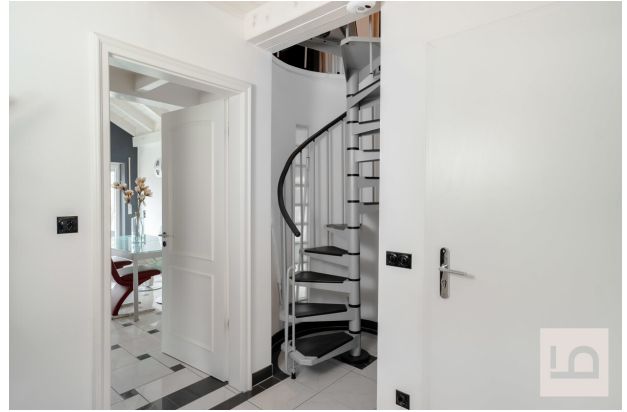
Treppe zur Galerie