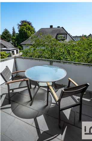
_Blick vom Balkon