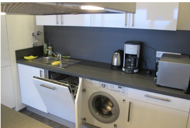
EBK mit Waschmaschine und Geschirrspüler