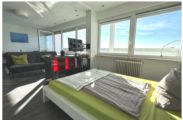
Blick vom Bett