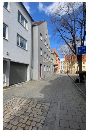
Blick zum Rathausplatz