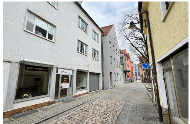
Ansicht von aussen