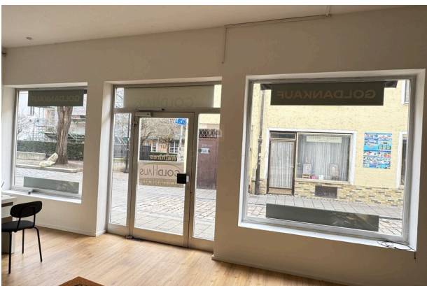
Schaufenster von innen