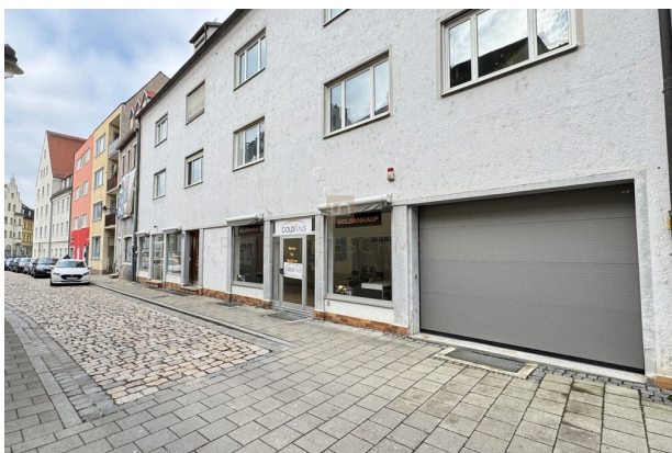
Blick auf den Laden