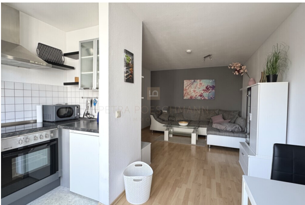
Blick von Küche in Wohnbereich