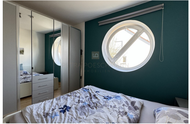
Schlafzimmer mit großem Schrank