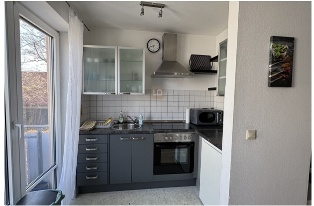
Küchenzeile neben Balkon