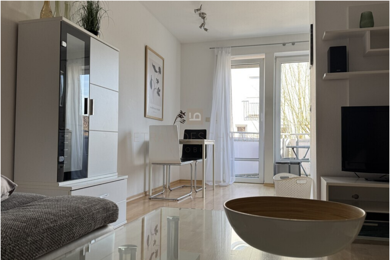
Blick zum Essbereich