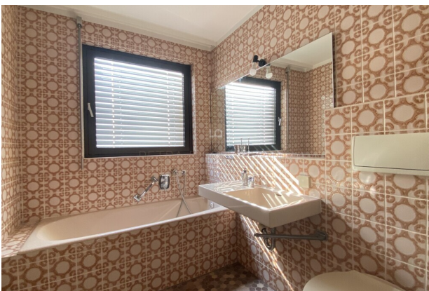
Badezimmer mit Wanne