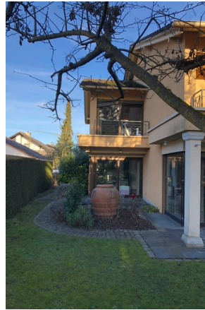
Ansicht Terrasse und Balkon