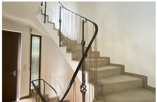
Treppe zum Schlafzimmer und Bad