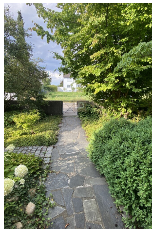
Weg zur Wohnung