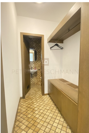
Garderobe mit Gäste-WC