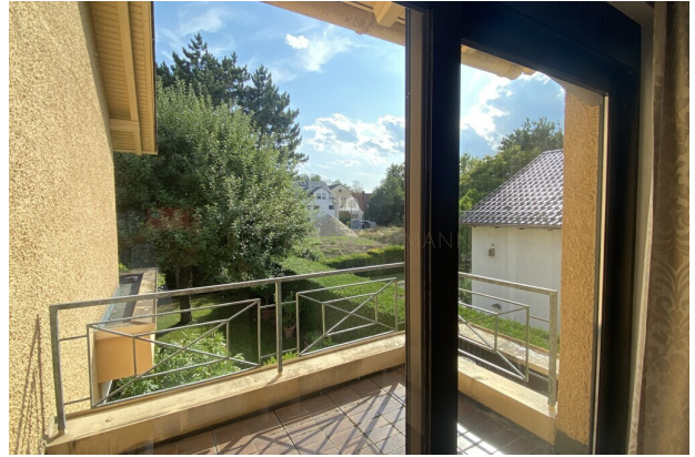
Balkon vom Schlafzimmer