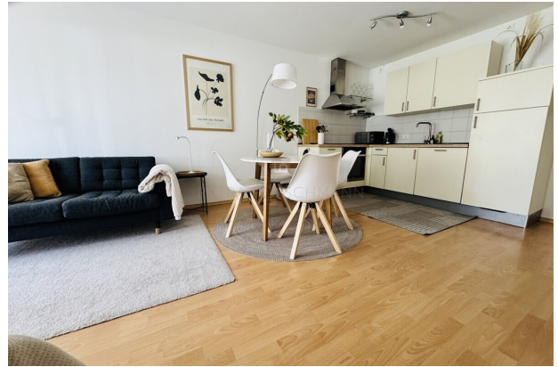
moderne Küchenzeile mit sämtlichen Geräten