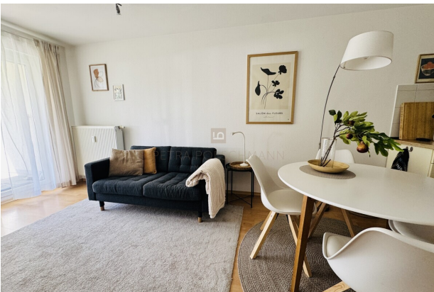
sehr gemütliche Couch