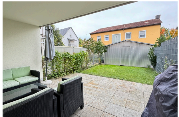
Terrasse mit Garten