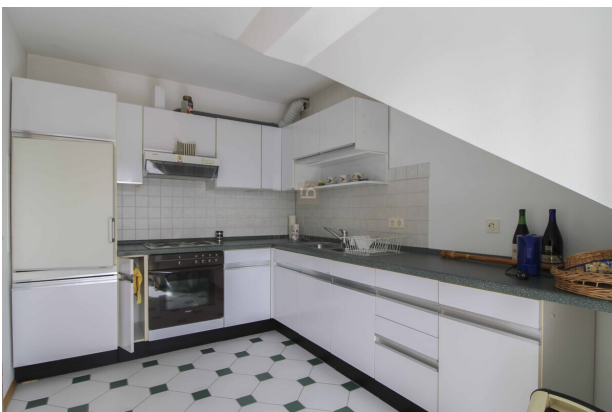
Küche (wird erneuert)