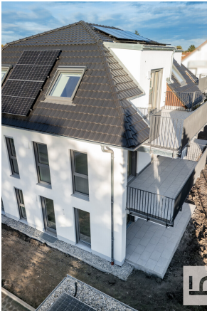
Balkon und Terrassenansicht