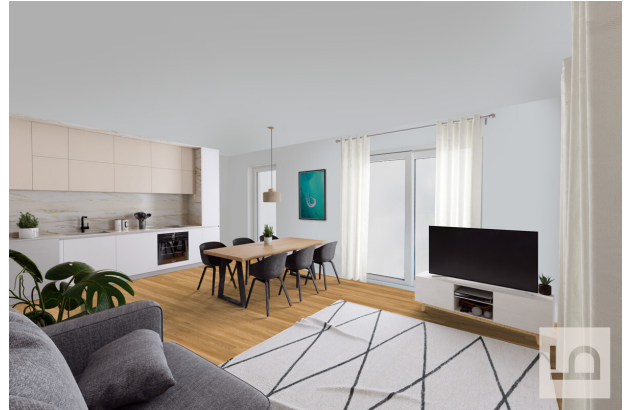
Küche-Wohnen virtuelles Staging