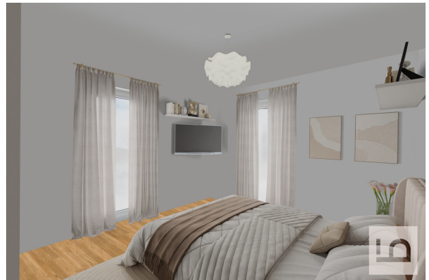
Schlafzimmer I virtuelles Staging