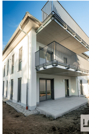
Terrasse und Balkon 1.OG