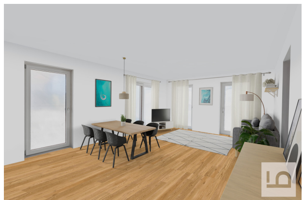
Wohnzimmer virtuelles Staging