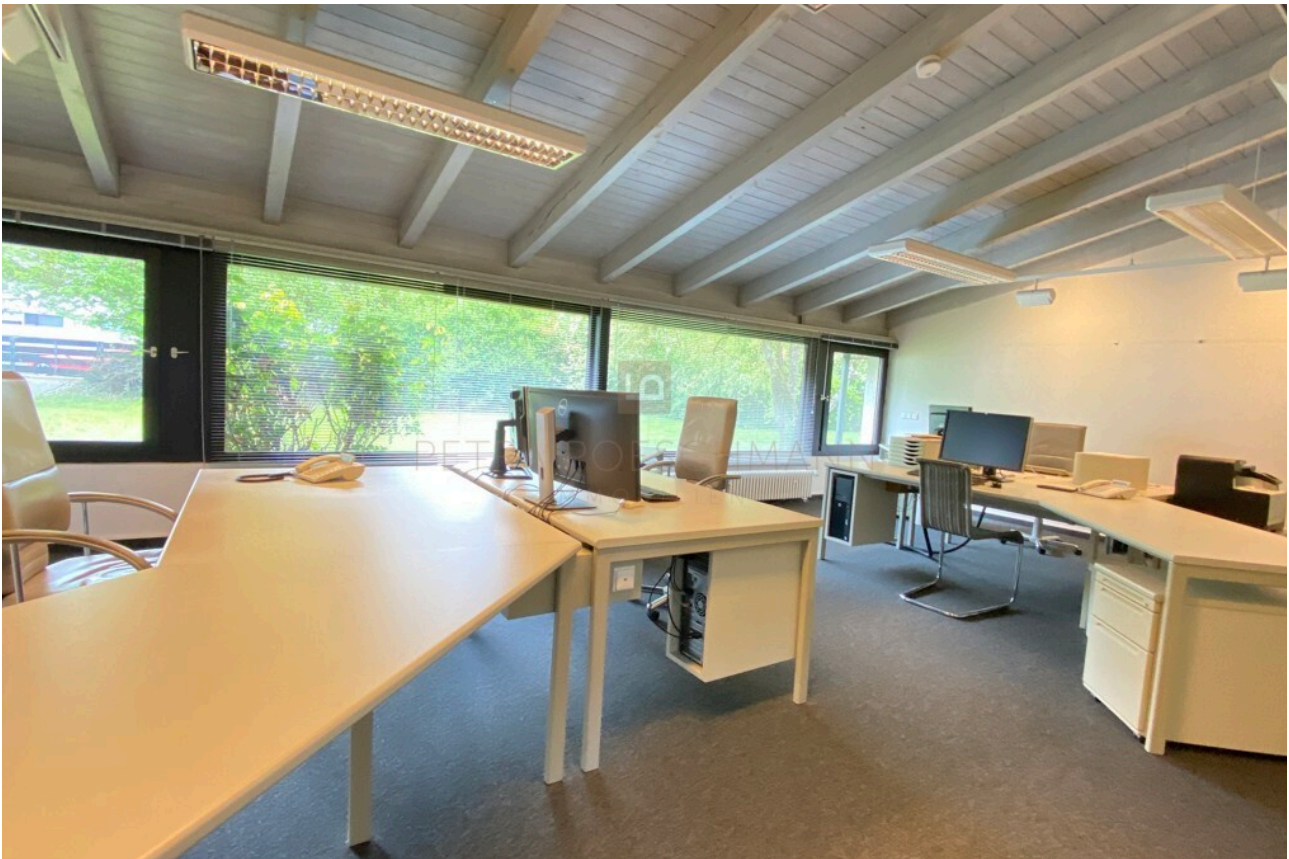
großes Büro I