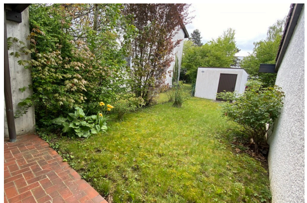
Terrasse mit Garten