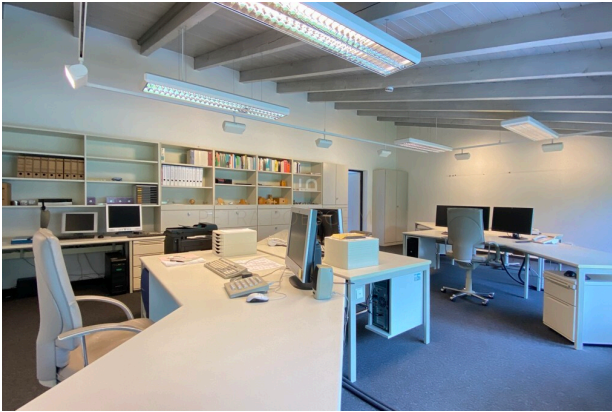
großes Büro I