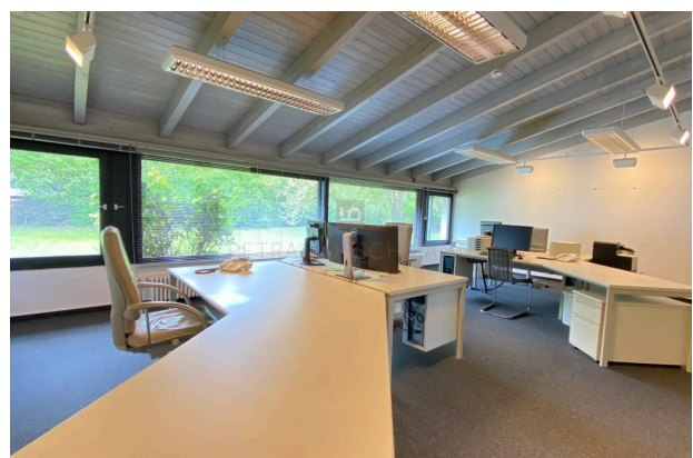
großes Büro I