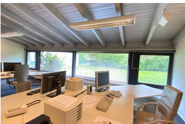
großes Büro I