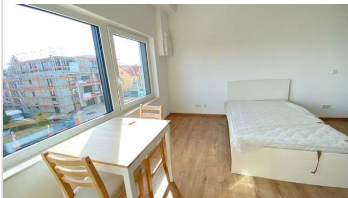
APP 16 Fenster