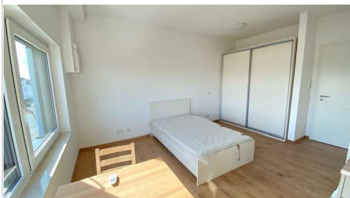
APP Bett und Schrank