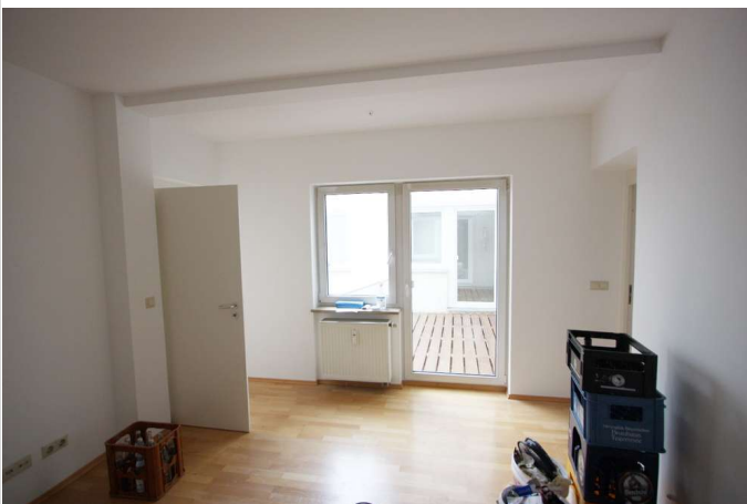
Blick auf Freisitz