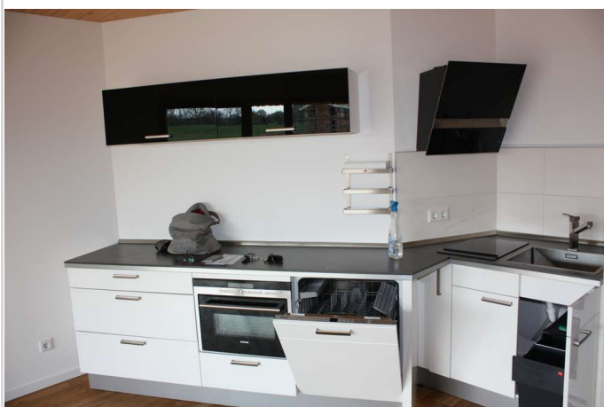
Küche kann abgelöst werden