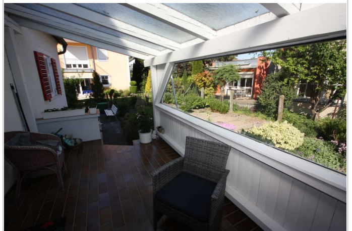
Blick in Garten