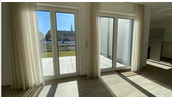
Blick aus Wohnzimmer

Zimmer: 3,00 Wohnfläche ca.: 87,00 m 2 Kaltmiete: 1.100,00 EUR (zzgl. Nebenkosten) Gesamtmiete: 1.390,00 EUR