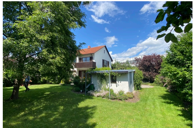
Haus mit Garage vom Garten