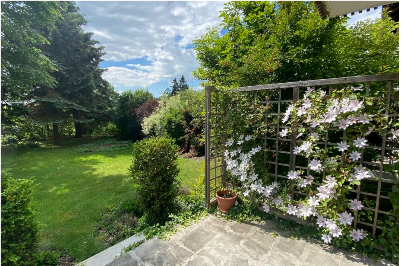
Blick von Terrasse